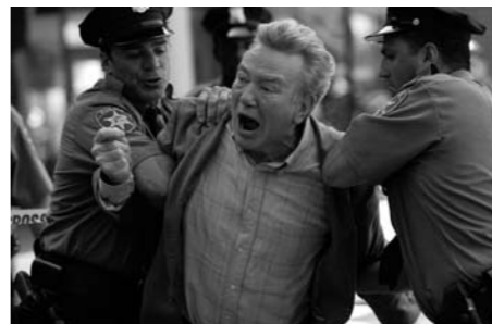
Before the Devil Knows you're Dead