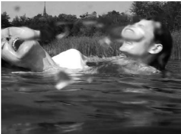
L.A. Raeven, still uit Love knows many faces , 2005

Het Netwerk Museum omvat een aantal werken die kunstenaars schonken. Uit dit archief worden tijdens het event een aantal werken getoond.