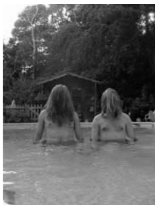
Shit and shine