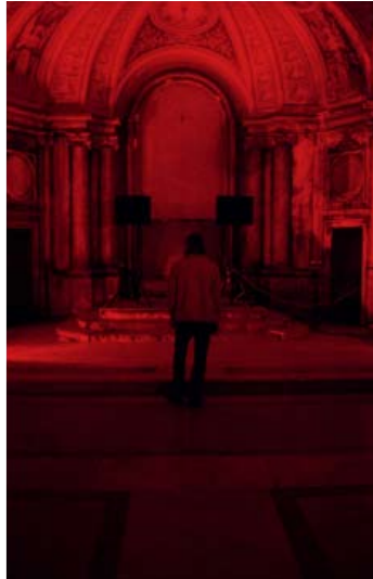
PH.ON, Lucifer 2005 , red light and sound from djset, environmental dimensions.