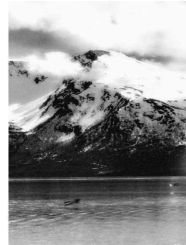
PH.ON, U.F.O. 2007 , print on paper variable dimensions, environmental dimensions.

Een tentoonstelling is een ruimte voor concentratie, waar concepten als tijd en ruimte samengebond en op intense manier beleefd worden. Uiteenlopende situaties, waarin fictionele en sociale ('werkelijke') elementen dooreengeweven worden, komen bijeen te staan, waardoor ongelofelijke mogelijkheden ontstaan om grenzeloze perspectieven met elkaar te verbinden. Anders gezegd: een tentoonstelling kan een speciaal moment creëren, waarin de bezoeker in staat is om een stap verder te gaan en situaties te beleven die in een andere omgeving en op een ander moment plaats vinden. Historische, politieke en sociale elementen worden in de verbeelding en in het dagelijkse leven opgenomen. De titel Cabinet of Imagination verwijst naar een bijzondere ruimte die, zelfs al is ze klein, de potentie heeft om uiteenlopende elementen te integreren en in een betekenisvolle context te plaatsen. De kunstenaars creëren een ruimte binnen de ruimte, een realiteit binnen een andere realiteit; als een spel met Chinese dozen, waarbij observatie geldt als enige kompas.