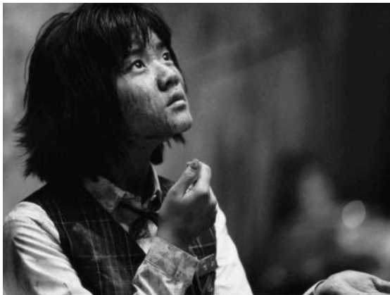
The Host, Bong Joon-Ho © ?