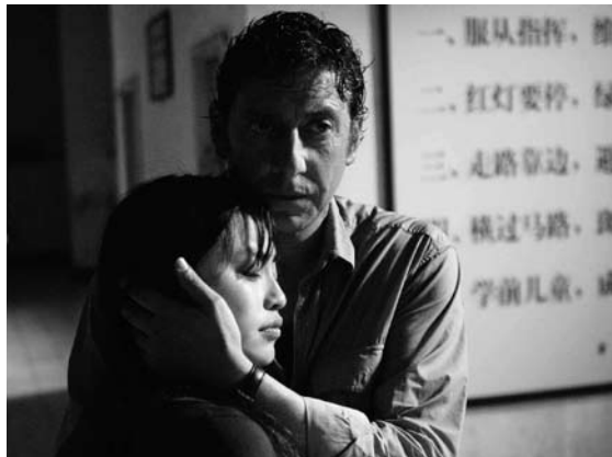
La Stella Che Non C'è, Gianni Amelio © ?