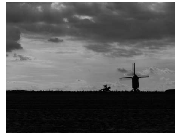
Zorro Rides, 2007 © HAP

Kunst & Zwalm, de tweejaarlijkse tentoonstelling van vzw Boem, ging van start in 1997. Een belangrijke constante is de interactie met het omliggende landschap: over een periode van tien jaar groeide Kunst & Zwalm uit tot een veelvormig experiment waarbij de intenties van de kunstenaars, de inwoners en de bezoekers elkaar overlappen en bevragen. De catalogoog van de jubileumeditie 2007 documenteert de bijdragen van de zeventien Vlaamse, Franstalige en Duitstalige kunstenaars.