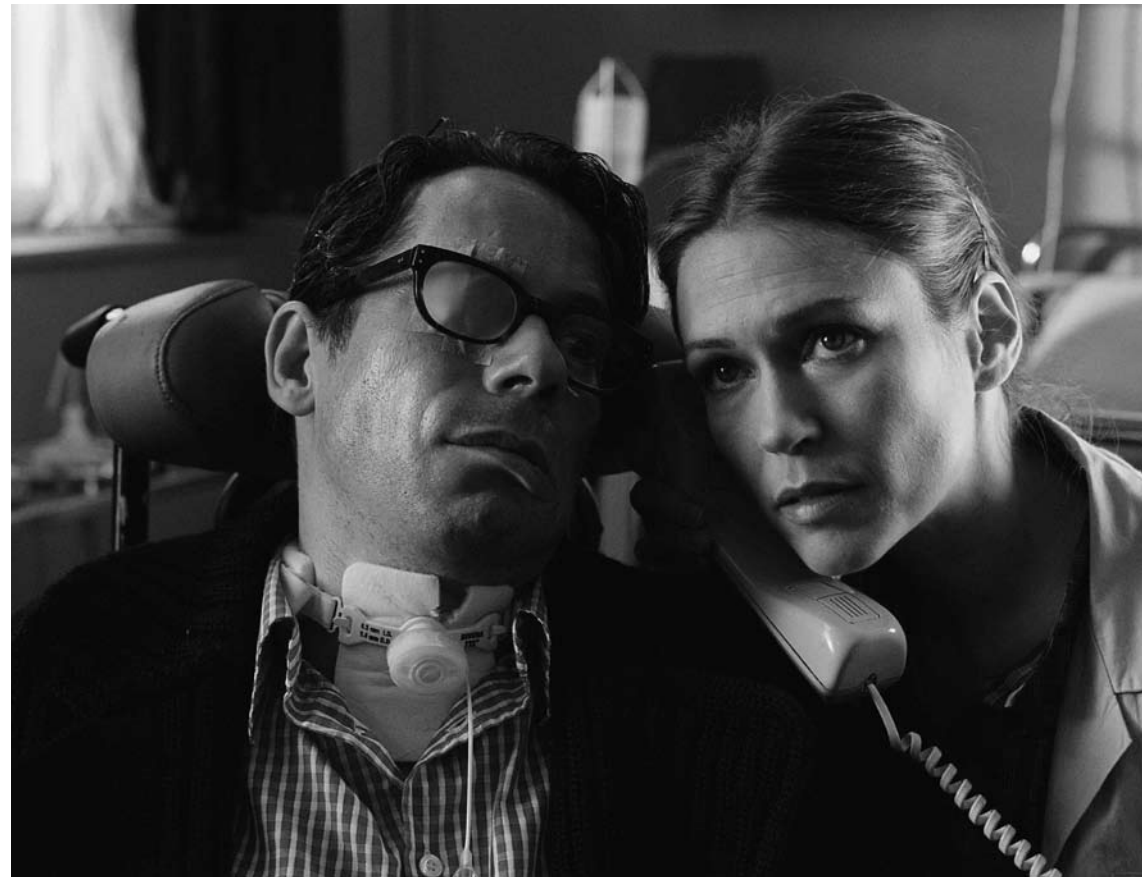
Le Scaphandre et le Papillon, Julian Schnabel

met: Samuel L. Jackson, Christina Ricci, Justin Timberlake