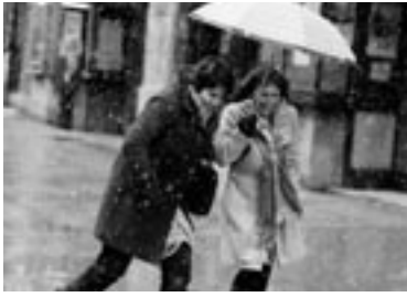
Grhavica , Jasmila Žbanic