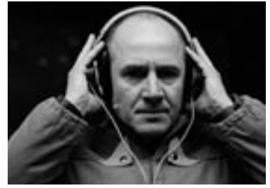
Das Leben der Anderen , Florian Henckel von Donnersmarck