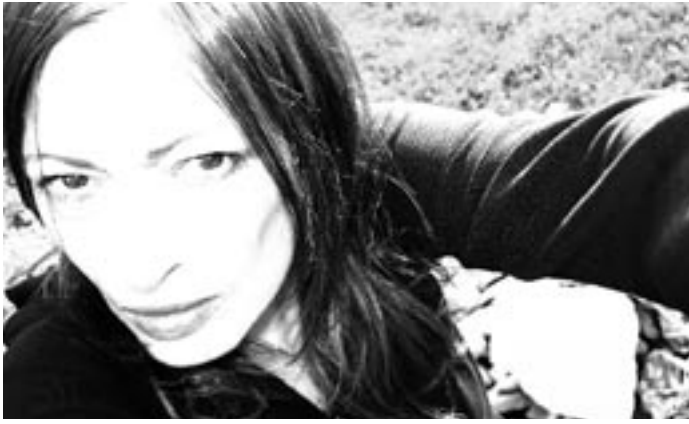
Gudrun Gut

Morgenstern, Milenasong, Laurenz Pike). Op haar laatste plaat / put a record on wordt haar evocatieve, doorleefde stem met minimale techno en instrumentale experimenten in de verf gezet.