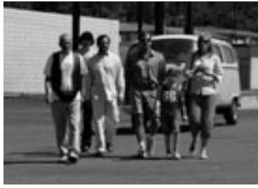
Little Miss Sunshine , Jonathan Dayton en Valerie Faris