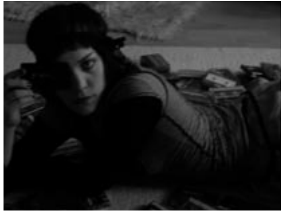
Milenasong © Monika Enterprise