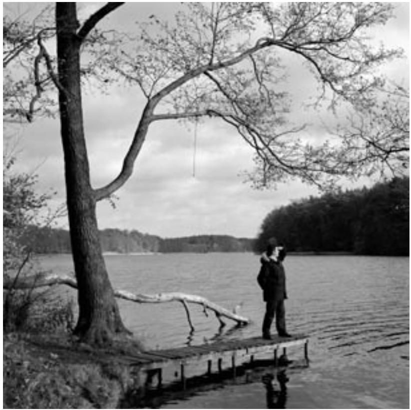
Pole © Kai von Rabenau