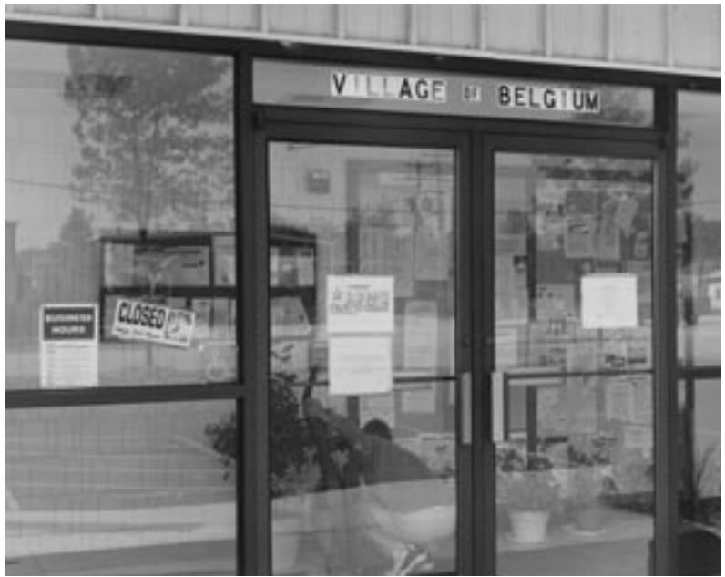
Belgium, Wisconsin, foto van de locatie (Vincent Meessen), 2005