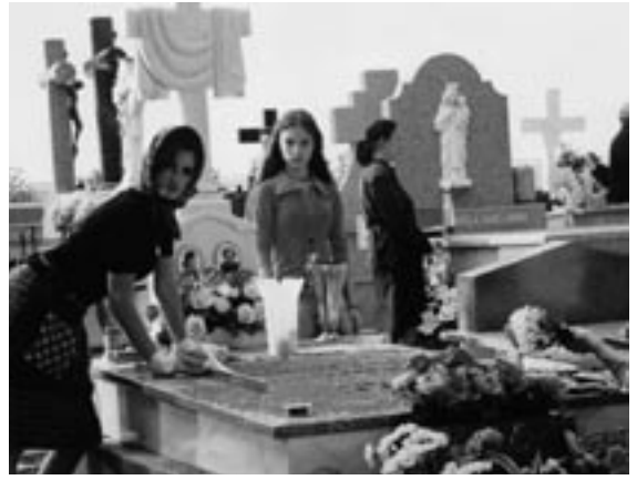
Volver , Pedro Almodóvar

vertolking van de egocentrische intellectueel met een meerderwaardigheidscomplex is een plezier om naar te kijken. (De Standaard)