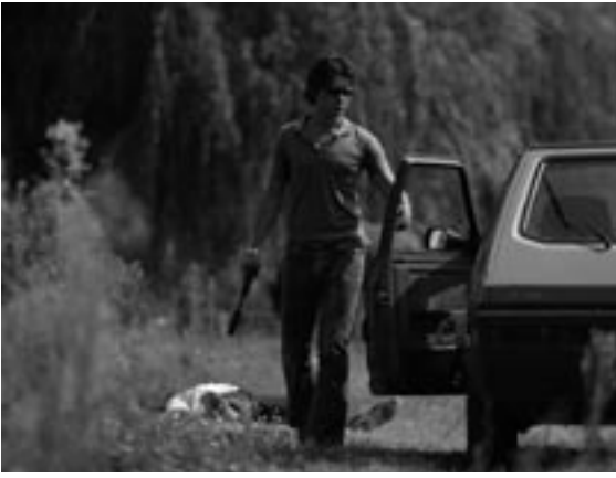
Romanzo Criminale , Michele Placido