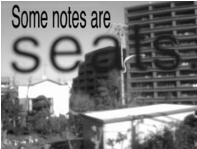
Heine Røsdal Avdal – Some notes are

tijdens de repetities verzameld zijn, die voornamelijk handelen over de netwerksamenleving waarin we sinds het einde van de twintigste eeuw leven. De nivellering van de machtstructuren in onze maatschappij, die een afspiegeling vindt in de wisselende set-up van de zaal, dient dus ook als motief voor het onvoorspelbare verloop van de performance.