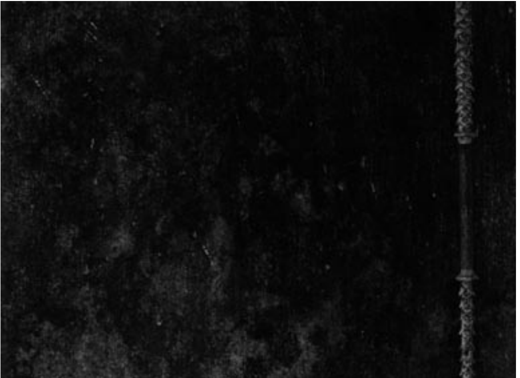
Melvin Moti – uit The Black Room , 2006 - videostill