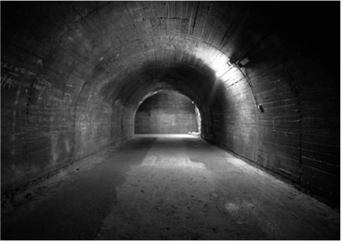
Els Vanden Meersch – uit Implants , 2006