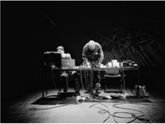
Phill Niblock & Thomas Ankersmit

malisme, extreme vormen van improvisatie en puur klankonderzoek spelen een grote rol in zijn werk. In zijn solosets creëert Ankersmit met behulp van een EMS synthesizer en computer zorgvuldig opgebouwde noisescapes die hij laat versmelten met het geluid van zijn altsaxofoon. In de sets met Niblock laat hij het geluid van zijn vaak onversterkte saxofoon in botsing komen met Niblock's drones: hij verplaatst zich binnen de ruimte en zoekt bepaalde harmonieën op die hij via microtonen opnieuw bewerkt.