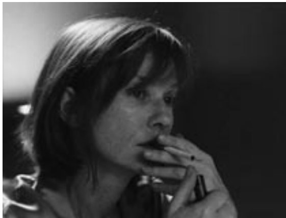
L'Ivresse du pouvoir, Claude Chabrol