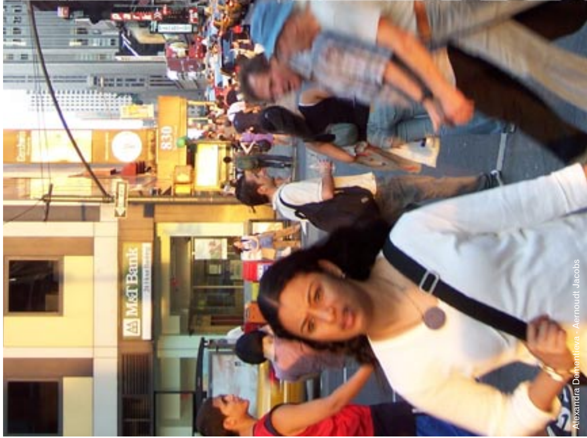
Alexandra Deментieva