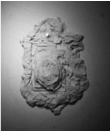
Audrey Reynolds, Avon, 2003