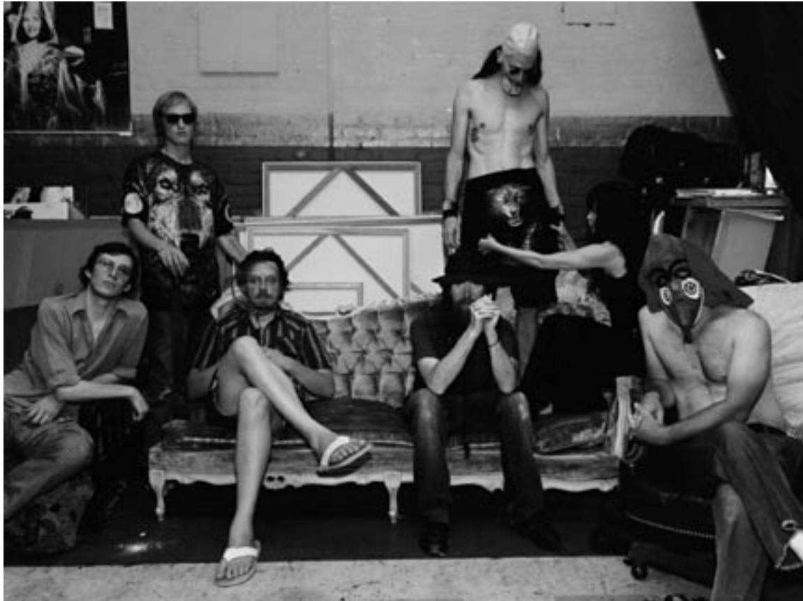
The No-Neck Blues Band

Met hun nieuwe plaat Qvaris (5RC) evenaren ze het onvolprezen Sticks And Stones May Break My Bones But Names Will Never Hurt Me uit 2001 en leveren ze misschien wel hun meest toegankelijke werk tot dusver. De percussie is wat naar de achtergrond verschoven en maakt deze keer plaats voor meer melodie, waardoor men bijna geneigd is te spreken van 'songs', dit gedrenkt in de typische free-spirit. Houdt u dus klaar, want voor wie denkt dat men nog bezig is met het stemmen van de instrumenten, The No-Neck Blues Band is al begonnen!