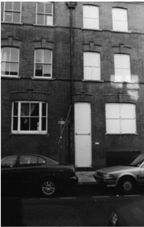
Jozef Somerlinck, Nostalgie Fordham street, London 2001