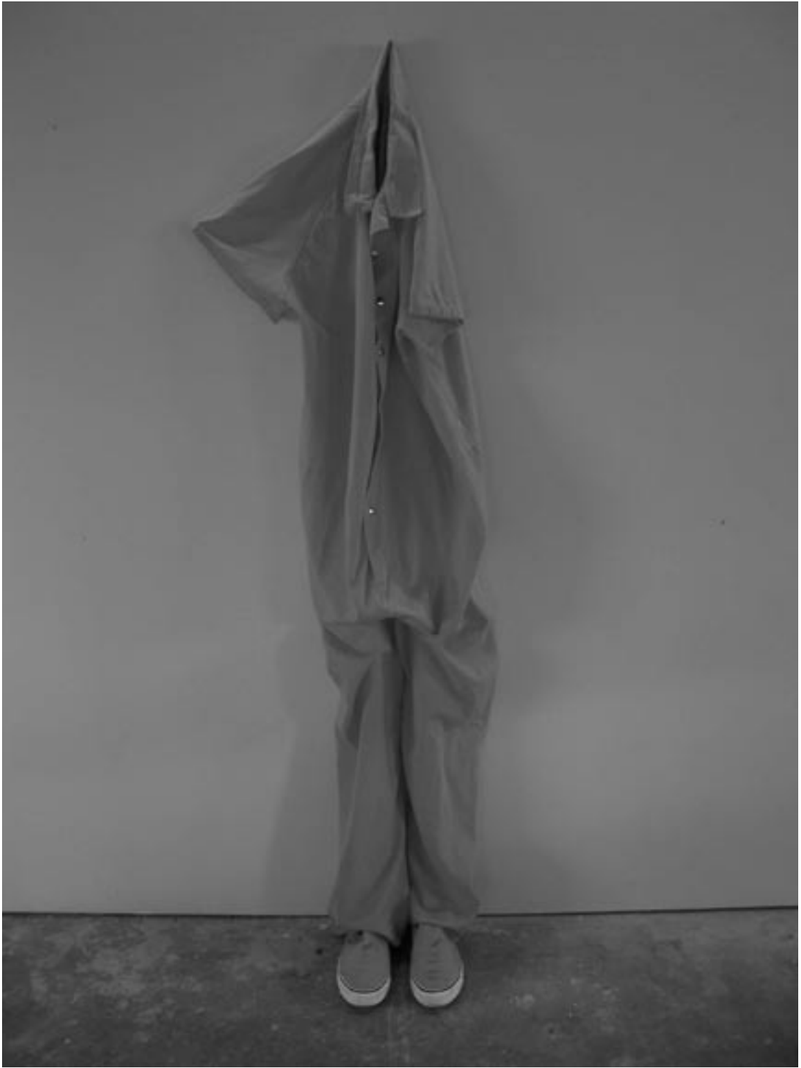
Yves Vanpevenaeghe, fragment uit de installatie The Killing , 2004 (Annual 04-05)