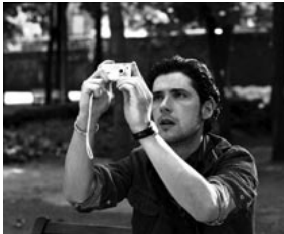
Le Temps qui reste