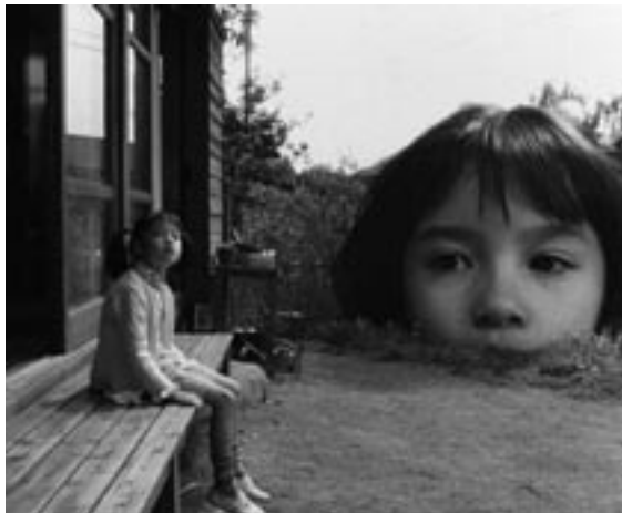
The Taste of Tea