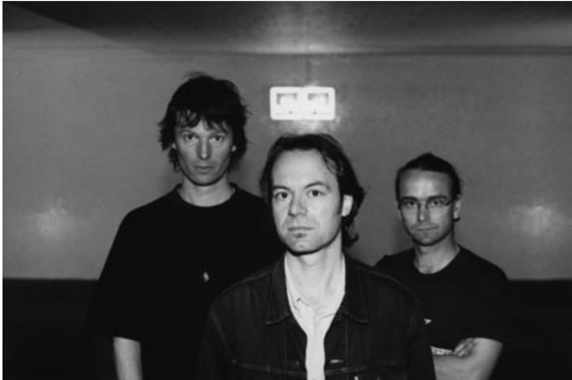
Steamboat Switzerland

gelegd en beperkt kader. Tijdsduur, ruimte, scenografie, muziek, licht en kostuums worden op voorhand gekozen en zijn dezelfde voor alle vier delen. De tijdslimiet van 10 minuten per solo vraagt de compacte overdracht van een idee. Het formaat van vier keer 10 minuten geeft ons de mogelijkheid een voorstelling in volle lengte te construeren, die gezien kan worden als eenheid of als vier onafhankelijke delen. Alle andere factoren zijn gekozen vanuit de mogelijkheden in de tijdstructuur. Ze functioneren als onafhankelijke elementen die een sterke invloed hebben op het werk en accentueren het feit dat het kader identiek is in meerdere aspecten. Denkend vanuit het werkproces kan dit project gezien worden als een uitdaging om de focus volledig op de choreografie te leggen. Aangezien het kader (ruimte/ tijd/ licht/ kostuum/ muziek) niet meer veranderd kan worden, is de performer het enige werktuig waarmee de choreografe haar solo moet maken. Door de danseres te accentueren als het enige veranderlijke element, wordt de toeschouwer uitgenodigd om de dans zelf diepgaander te bekijken. Het geluid van die voorstelling, waarin een op voorhand uitgekozen muziekstuk wordt geïntegreerd (met name Fuga G Major- BWV 577 van Johann Sebastian Bach), is gecreëerd door Arnaud Jacobs.