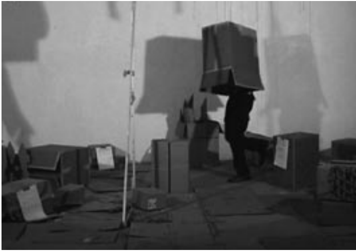
Steve Schepens, Horror 7 - 2005 / videoperformance © Steve Schepens 2005