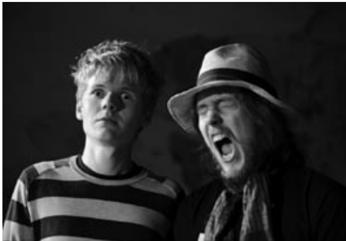
MoHal © Johannes Worsøe Berg