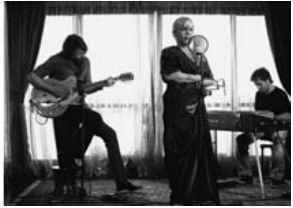
Crossing The Bridge - The Sound of Istanbul

hebben doorgebracht met hun familie en zonder afscheid te hebben mogen nemen, worden ze met explosieven aan hun lichaam naar de grens gebracht. Maar de actie verloopt niet zoals gepland. Genomineerd voor de Oscar Beste Buitenlandse Film 2006.