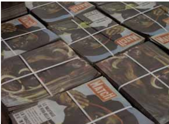
Vincent Meessen, "Fac Dissimile"

De tentoonstelling is nauw verweven met Vincent Meessens onderzoeksproject en boek Prospectus . Meessen achtte de Film+avond het ideale moment om samen met verschillende sprekers een unieke preview te geven van Prospectus .