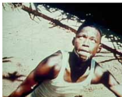
Les Maitres Fous

i.c.w. La Malterie (Lille) and Espace Khiasma (Paris).