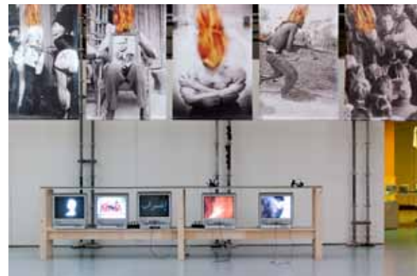
Mohamed El baz, Africa Remix