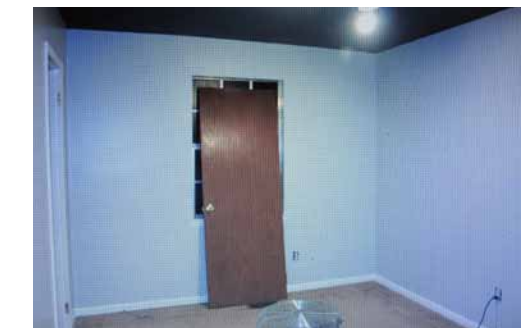
Laurent Dupont-Garitte, Empty room

The '-scape' in Escape réunit un vaste éventail d'environnements, d'installations lumineuses, sonores ou vidéo. L'exposition rassemble différentes visions qui se complètent, s'augmentent ou se corrigent les unes les autres, avec des références à l'idéal et au réel, et exprime une rencontre entre le conceptuel et le sculptural dans un cadre architectural.