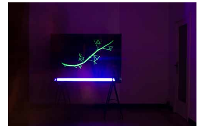
Fia Cielen, Dark Decades , 2010