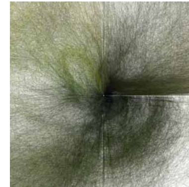
Frederik De Wilde, Numerical Recipe Series [NRS] # Vectors 4 [un]Certainty 1 , 2010

De tentoonstelling maakt deel uit van het Europees project Interreg IVa '2 Mers Seas Zeeën Grensoverschrijdend samenwerkingsprogramma 2007-2013'. Dit project is een samenwerking tussen Aspex (Portsmouth), Boem vzw (Kunst & Zwalm), Fabrica (Brighton), l'H du Siège (Valenciennes), La Malterie (Lille) en Netwerk (Aalst). Onder het motto 'Investeren in je toekomst' worden duurzame strategieën voor publieksparticipatie ontwikkeld.