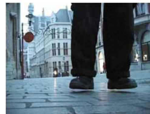
Honoré δ'O, We zijn bijna in Leuven (videostill) 2001