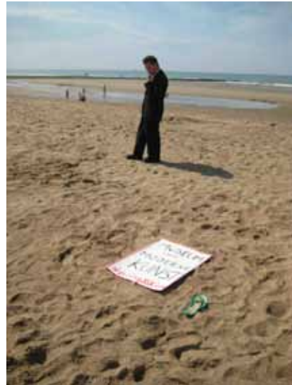
Marcel, met Douglas Park

[FRA] 'Marcel' est une fiction sur la rencontre improbable de Duchamp, Mariën et Broodthaers, dans une mise en scène rocambolesque et des collages imprévus rendant possible la réapparition de ces fantômes du surréalisme. Le film est signé par un collectif du même prénom. Marcel prend pour point de départ un film de Mariën, 'L'imitation du cinéma' (1959), une satire du livre 'L'imitation de la vie de Jésus-Christ' (1424). Le film de Mariën sera également projeté lors de la première.