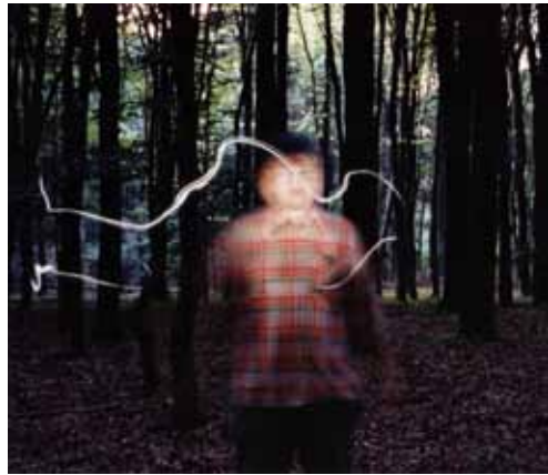
Black To Comm