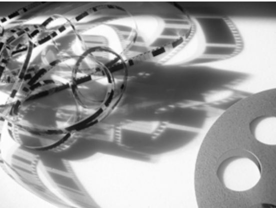
Stephan Mathieu Process

tickets € 10 / 7 tentoonstelling open 14 00 > 20 30