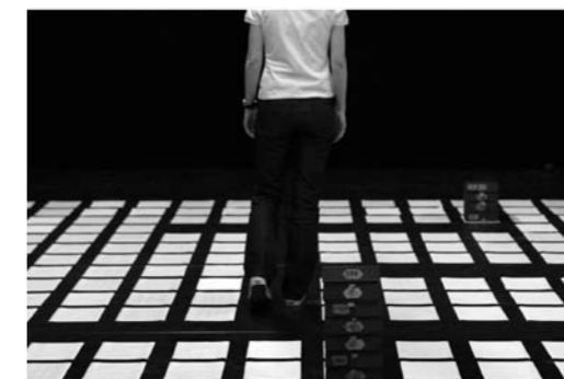
deepblue, you are here , 2008