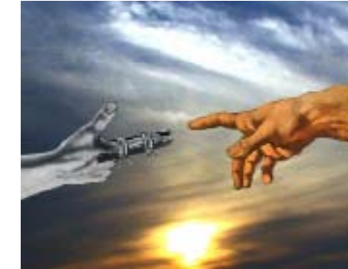
Effi & Amir, OMG , videostill, 2008