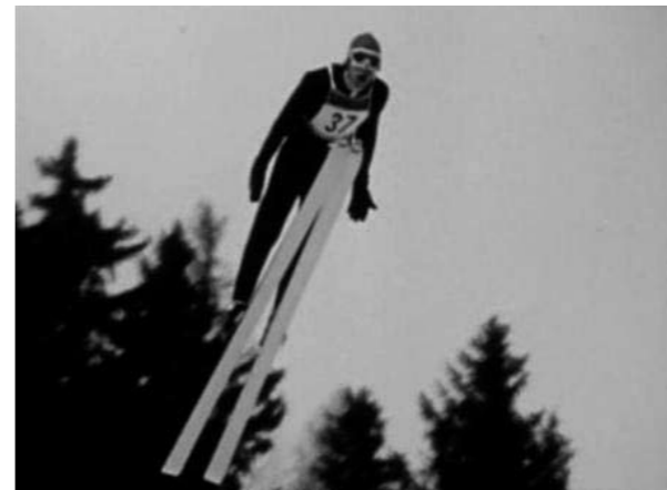
Werner Herzog, The Great Ecstasy of the Woodcarver Steiner