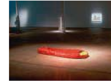
Neal Beggs, Sleeping Bag